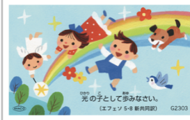
G2303／光の子カード エフェソ5・8