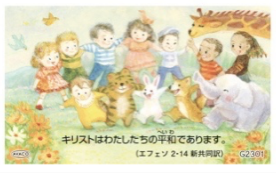
G2301／平和カード エフェソ2・14

夏休み・冬休み・春休みにおすすめの聖句カード 各15円(税込) ※聖句は、日本聖書協会発行『聖書 新共同訳』より引用しました