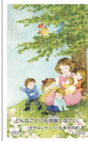
G2305／感謝カード テサロニケ I 5・18