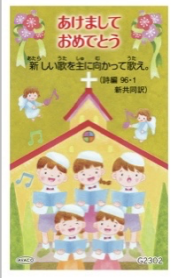
G2302／新年カード 詩編96・1