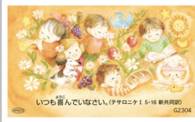
G2304／感謝カード テサロニケ I 5・16