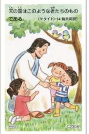
G2306／祝福カード マタイ19・14